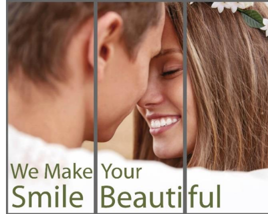
Zona visible de las gráficas: 94 cm x 234 cm