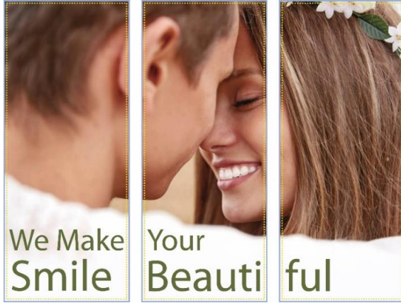
Medidas de las gráficas: 100 cm x 240 cm